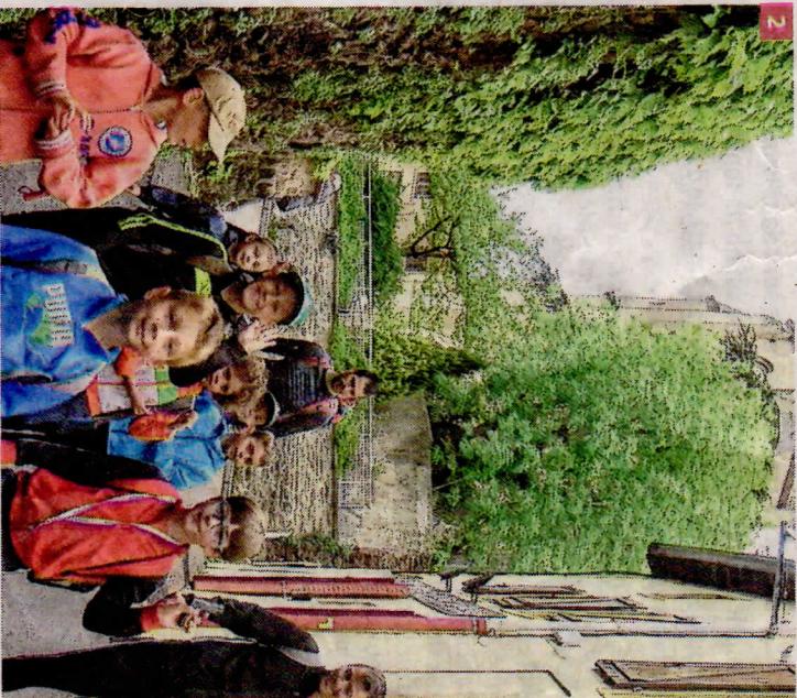
2 Beaucoup d'enfants ont participé à la randonnée.

Quatre parcours étaient proposés : le parcours Cogneil-cot de 5 km, Jonquille de Lyon, de Vienné, de la proche Vallée du Rhône, de Saint-Genest-Malifaux... »