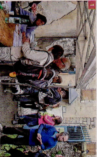
1 La météo douce mais incertaine n'a pas découragé les nombreux marcheurs.